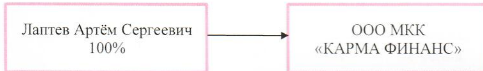
Схема взаимосвязей ООО МКК «КАРМА ФИНАНС» и лиц, оказывающих существенное (прямое или косвенное) влияние на решения, принимаемые органами управления ООО МКК «КАРМА ФИНАНС»

Генеральный директор ООО МКК «КАРМА ФИНАНС»